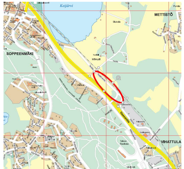
Alueen likimääräinen rajaus opaskartalla

Asemakaava-alue sijaitsee Kirkonseudulla, taajaman eteläpuolella, rajautuen eteläosastaan Vaasantiehen (kantatie 65) ja pohjoisosasta Keijärventiehen ja tien viereiseen Tampere-Seinäjoki päärataan. Alueen alustava pinta-ala on noin 8,5 hehtaaria. Alue on pääosiltaan rakentamatonta peltoaluetta.