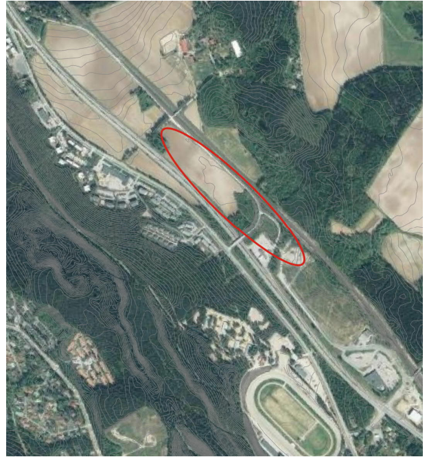
Alueen likimääräinen rajaus ilmakuvassa

Alue on yleisilmeeltään loivasti luoteeseen viettävää peltoaluetta. Reuna-alueilla on metsäsaarekkeita. Alueen pohjoisreunassa luoteis-kaakkosuuntaisesti kulkeva Keijärventie kääntyy lounaaseen Vaasantien yli, yhdistyen Mikkolantiehen. Eteläreunassa ovat korkeusvaihtelut, pengerryksistä johtuen, suurempia. Suunnittelualue on kaupungin omistuksessa. Aluetta ei ole aikaisemmin asemakaavoitettu.