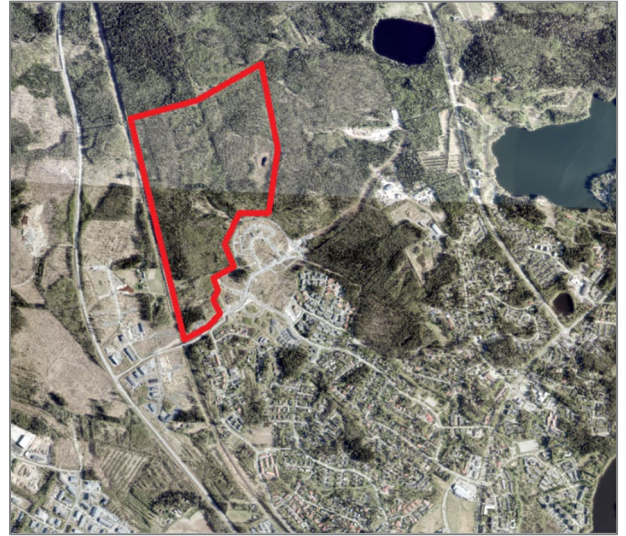
Alueen likimääräinen rajaus ilmakuvassa

Suunnittelualueen pohjoispuolella on Perkonmäen Natura 2000 luonnonsuojelualue, jonka kaakkoiskulma on lähimmillään n. 80 metrin ja lounaiskulma n. 280 metrin päässä asemakaavoitettavan alueen rajasta. Natura 2000-alueen etelä- ja itäpuolella on osayleiskaavassa osoitettuja laajoja suojaviheralueita.