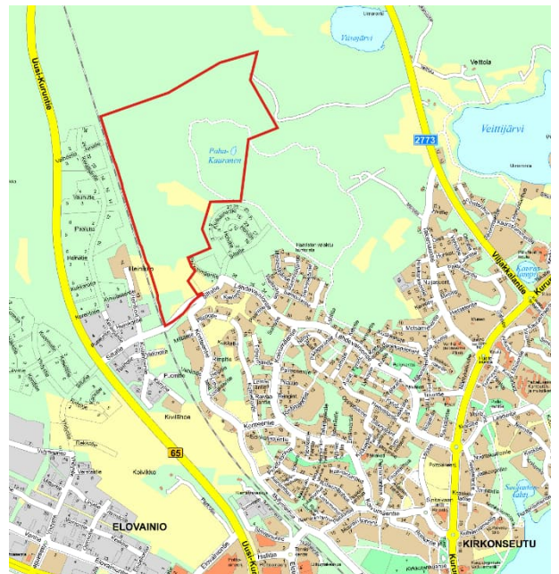
Alueen likimääräinen rajaus opaskartalla punaisella, päivitys 26.10.2022

Alueen eteläosaan v. 2005 hyväksytyn, mutta toteuttamatta jääneen Sammontien asemakaavan loppuosan kumoaminen on hyväksytty kaupunginvaltuustossa 8.6.2020, § 34. Rautatien länsipuolella sijaitsevat Heinikon teollisuusalueen asemakaavat, joista eteläisin on hyväksytty 17.12.2009 ja pohjoisin asemakaavan muutos on hyväksytty 2.9.2019. Heinikon teollisuusalueen pohjoisosan asemakaavan muutoksessa on varauduttu rautatien kanssa risteävän katuyhteyden toteuttamiseen radan alituksena.