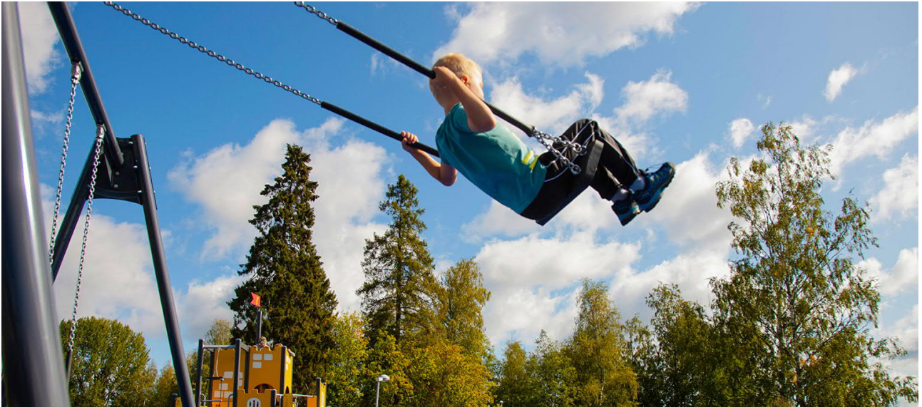
kuva päiväkodin pihalta